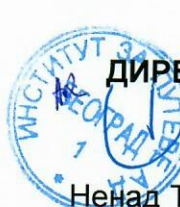
Ненад Томић, маст.инж.грађ.