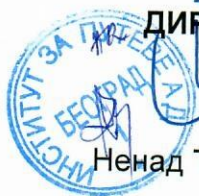
Ненад Томић, маст.инж.грађ.